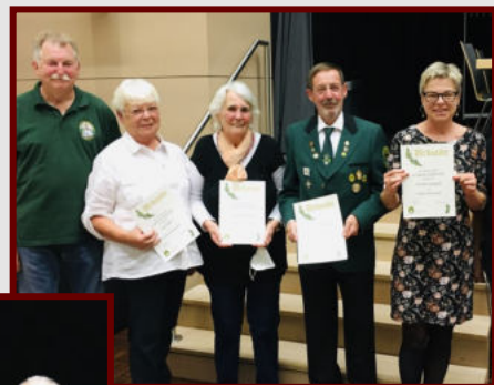
Ehrungen für langjährige Mitgliedschaft