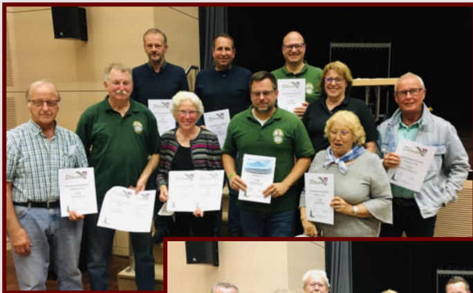
Ehrungen für sportliche Erfolge